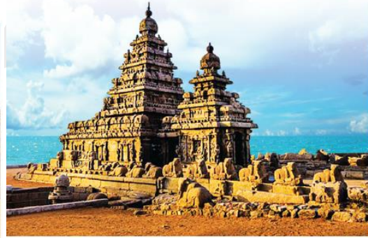
கடற்கரைக் கோயில் -மாமல்லபுரம்