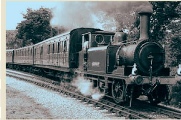
முதல் புகைவண்டி பம்பாய் (மும்பை)-தானே