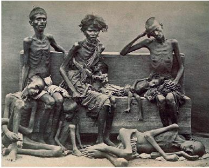
தாது வருடப் பஞ்சம், சென்னை