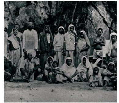
ஒப்பந்தக் கூலித் தொழிலாளர்