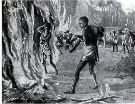
பிண்டாரிகளிடமிருந்து தப்பிக்க மக்களே தீ வைத்துக்கொள்ளல்

பிண்டாரி கொள்ளைக்கூட்டத்தில் இஸ்லாமியர்கள், இந்துக்கள் என்ற இரு சமயத்தைச் சார்ந்தவர்களும் இருந்தனர். துணைப்படைத் திட்டத்தினால் வேலையிழந்த பல வீரர்கள் இக்கொள்ளைக்கூட்டத்தில் சேர்ந்து கவலை கொள்ளும் அளவுக்குப் பெருகினர். பிரிட்டிஷ் அரசு பிண்டாரிகள் மீது போர்ப் பிரகடனம் செய்தது. ஆனால் அது மராத்தியருக்கு எதிரானப் போராக உருப்பெற்றது. இப்போர்கள் பல்லாண்டுகள் (1811 - 1818) நடைபெற்றாலும் மொத்த மத்திய இந்தியாவையும் இறுதியில் பிரிட்டிஷார் வசம் கொண்டு சேர்த்தது.