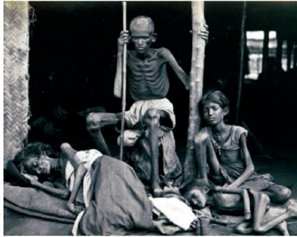
ஒரிசாவில் ஏற்பட்ட பஞ்சம்