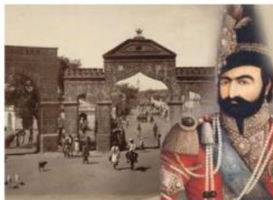
அலாவுதீன் ஹசன் பாமன் ஷா

அலாவுதீன் ஹசன் பதினொராண்டுகள் ஆட்சி புரிந்தார். வாரங்கல் அரசிடமிருந்தும், ராஜமுந்திரி, கொண்டவீடு ஆகிய ரெட்டி அரசுகளிடமிருந்தும் ஆண்டுதோறும் கப்பம் வசூலிக்க அவர் மேற்கொண்ட முயற்சிகள் அடிக்கடி போர்கள் ஏற்பட வழிவகுத்தன. அவர் தமது அரசை நான்கு மாகாணங்களாகப் பிரித்தார். அவை தராப் என அழைக்கப்பட்டன. ஒவ்வொரு மாகாண ஆளுநரும் படைகளுக்குத் தலைமையேற்றனர். அப்பகுதியை நிர்வாகம் செய்வதும், வரிவசூல் செய்வதும் அவருடைய பொறுப்பாகும். வலிமை மிகுந்த அரசர்களின் கீழ் இம்முறை சிறப்பாகச் செயல்பட்டது. வலிமைகுன்றிய அரசர்களின் காலத்தில் இம்முறையின் ஆபத்து வெளிப்படையாகவே தெரிந்தது.