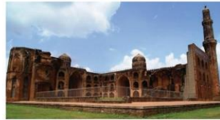
மகமது கவான் மதராசு

பாமினி அரசை நிறுவிய அலாவுதீன் ஹசன் ஷா, அலாவுதீன் கில்ஜியின் படைத் தளபதிகளின் ஒருவரான ஜாபர்கான் என்பவரின் முயற்சியால் மூல்தானில் கல்வி கற்றார். அவர் அரசரான பின்னர் தமது மகன்கள் கல்வி கற்பதற்காக ஒரு பள்ளியை நிறுவுவதில் சிறப்பு கவனம் செலுத்தினார். அவருடைய மகன் முதலாம் முகமது கல்வி கற்பதை ஆதரித்தவராவார். பிரபுக்கள் குடும்பங்களைச் சேர்ந்த குழந்தைகள் போர் வீரர்களுக்கான கலைகளில் பயிற்சி பெறுவதற்காகப் பயிற்சி நிறுவனங்களை ஏற்படுத்தினார். பாமினி அரசின் எட்டாவது சுல்தானான சுல்தான் பிரோஸ், மொழியியல் அறிஞரும் கவிஞரும் ஆவார். இவருக்குப் பின் வந்த அரசர்கள் குல்பர்கா, பீடார், தெளலதாபாத், காண்டகார் ஆகிய இடங்களில் கல்விக் கூடங்களை நிறுவினர். இப்பள்ளிகளில் உண்டு உறைவிட வசதிகள் அரசரின் செலவில் ஏற்படுத்தப்பட்டன. பீடாரில் அமைந்துள்ள உலகப் புகழ்பெற்ற, மகமது கவானின் மதராசு (கல்வி நிலையம்) 3000 கையெழுத்துப் பிரதிகளைக் கொண்ட பெரிய நூலகத்தைக் கொண்டிருந்தது. இவையாவும் கல்விக்கும், புலமைக்கும் கவான் அளித்த முக்கியத்துவத்தை தெளிவாகப் பறைசாற்றுகின்றன.