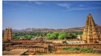
விருபக்சா கோவில் – ஹம்பி

கிருஷ்ணதேவராயரைத் தொடர்ந்து அவருடைய இளைய சகோதரர் அச்சுதராயர் ஆட்சிப் பொறுப்பேற்றார். இவருடைய ஆட்சிக் காலத்திலும் இவருக்குப் பின்னர் அரியணை ஏறிய முதலாம் வேங்கடர் காலத்திலும் முக்கிய நிகழ்வுகள் எதுவும் இடம் பெறவில்லை. இவர்களுக்குப் பின்னர் குறைந்த வயதைக் கொண்ட சதாசிவராயர் முடிசூட்டப்பட்டார். பகர ஆளுநராகப் பொறுப்பேற்றிருந்த ராமராயர் பேரரசின் திறமைமிக்கத் தளபதியாவார். சதாசிவராயருக்கு அரசு பதவி ஏற்கும் வயது வந்த பின்னரும் கூட அவரைப் பெயரளவிற்கு அரசராக வைத்துக் கொண்டு ராமராயரே உண்மையான அரசராக ஆட்சி புரிந்தார். இச்சமயத்தில் விஜயநகருக்கு எதிராகப் போர் புரிவதற்காகத் தக்காண சுல்தான்கள் ஓர் அணியில் திரண்டனர். எதிரிகளின் கூட்டுப்படைகள் 1565இல் தலைக்கோட்டை என்னுமிடத்தில் விஜயநகரப் படைகளை எதிர்கொண்டன. ராக்கச தங்கடி (தலைக்கோட்டைப் போர்) என்றறியப்பட்ட இப்போரில் விஜயநகரம் தோற்கடிக்கப்பட்டது. தொடர்ந்து நகரம் கொள்ளையடிக்கப்பட்டதோடு பயங்கரமான மனிதப் படுகொலையும் அரங்கேறியது. அனைத்துக் கட்டடங்களும், அரண்மனைகளும், கோவில்களும் அழிக்கப்பட்டன. அழகிய சிற்பங்களும், நன்கு கலைநயம் மிகுந்த வேலைப்பாடுகளும் சேதப்படுத்தப்பட்டன. இறுதியாக, விஜயநகரப் பேரரசு அழிக்கப்பட்டது.